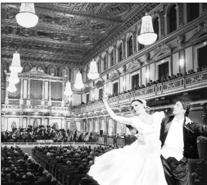
Le «Gala Viennois Concert de Johann Strauß», le 7 janvier à Lausanne

L'original du „Gala Viennois Concert de Johann Strauss“ se produit en tournée le 7 janvier à Lausanne